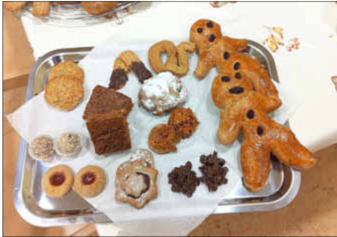
Die leckeren Back - Ergebnisse des Abends.

Am Mittwoch, 19.11.2014 fand in der Kita St. Leodegar ein Elternabend der anderen Art statt. Zum Thema »Gesund naschen - Eltern backen vollwertiges Weihnachtsgebäck« kam Frau Günther - Arand von der Verbraucherzentrale Merzig im Rahmen der Elternschule in Kooperation mit der CEB zu uns nach Düppenweiler.