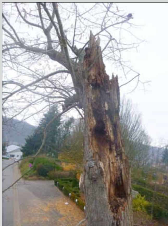
Die Schädigung im Kronenbereich ist unübersehbar

Wer seit letzten Donnerstag über die Friedhofstraße nach Haustadt hineingefahren ist, der hat es mit Sicherheit schon bemerkt: beide Linden am Friedhof - mitunter Wahrzeichen unseres Dorfes - sind entfernt worden. Nachdem bereits am Montag vergangener Woche der erste Baum gefällt worden war, musste vom Bauhof auch die zweite Linde aus Sicherheitsgründen entfernt werden. Auch diese Linde hätte einem Sturm oder hoher Schneelast nach Einschätzung des Gutachters nicht mehr standgehalten. Die Bilder hierzu wurden von Herrn Schmal zur Verfügung gestellt, sie zeigen die Schädigung im Kronenbereich und die weit fortgeschrittene Fäulnis der Baumstämme. Eine Ersatzbepflanzung wird im Frühjahr erfolgen.