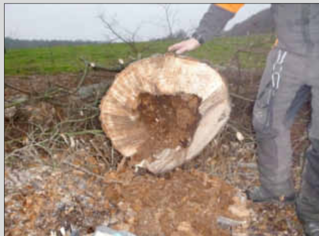
Die Fäulnis zerstörte die Linde im Inneren