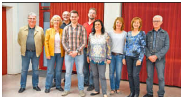
Der Vorstand steht bereit, um mit den Mitgliedern ein gutes neues Jahr 2018 zu gestalten

Ein ereignisreiches Jahr ist vorbei - mit sportlichen Erfolgen, auf die wir natürlich stolz sind. Aber auch mit einigen großen, aufwändigen Veranstaltungen...das wäre ohne zahlreiche helfende Hände an der