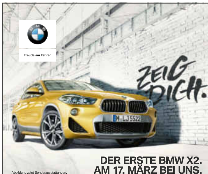
Abbildung zeigt Sonderausstattungen.

Bahnhofstraße 41 · 66663 Merzig Tel.: 0 68 61 / 7 49 61 · Fax: 0 68 61 / 7 49 62 E-Mail: kanzlei@ra-holgerbeck.de