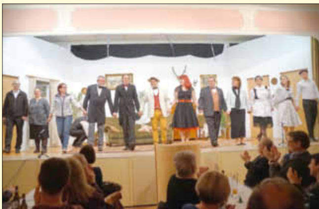
Die Mitwirkenden bedanken sich beim Publikum für den vielen Applaus.