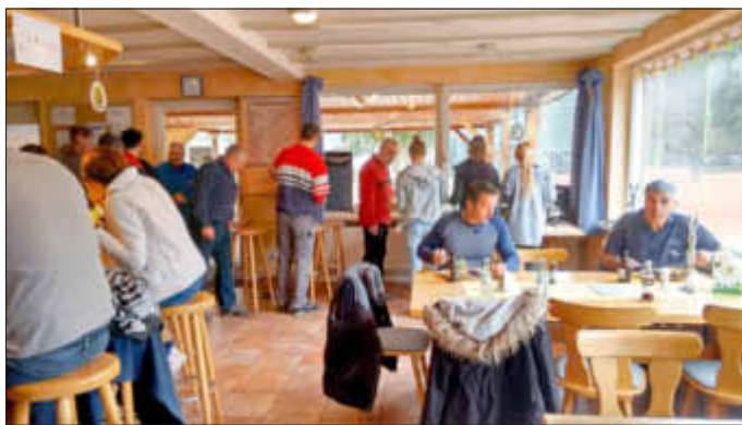
Endlich Mittagspause! Unsere Mitglieder stehen Schlange vor dem Buffet.

Trotz ungemütlichen Wetters und eines eisigen Windes wagten sich 34 junge und ältere Mitglieder am letzten Samstag auf unsere Clubanlage, um die ersten Arbeiten für die kommende Sommersaison zu verrichten. Einige mühten sich mit Steine schippen auf dem Dach ab, während andere begannen sorgfältig das Clubhaus zu streichen oder mit Schere und Schubkarren bewaffnet das Grünzeug um die Plätze herum bearbeiteten. Als zum Mittagessen gerufen wurde, waren wohl alle erleichtert und konnten sich erst einmal von innen und außen aufwärmen und ein bisschen ausruhen.