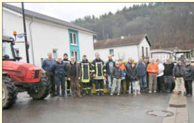
Die Teilnehmer in Erbringen

In Erbringen beteiligte man sich ebenfalls an der vom Ortsrat angesetzten Aktion. Um 10.00 Uhr trafen sich über 20 Helferinnen und Helfer an der Erwinger Scheier, um weggeworfenen Müll und Unrat aufzusammeln. Vier Traktoren mit entsprechender Ausrüstung machten sich mit den Fußgruppen auf den Weg und sammelten auf dem gesamten Erbringer Bann Abfall der verschiedensten Art, wie Autoreifen, Flaschen, Dosen, Folien, alte Möbel, Kunststoffteile usw. Nach Beendigung der Sammlung stärkten sich die Helferinnen und Helfer bei einem Imbiss in der Erwinger Scheier.