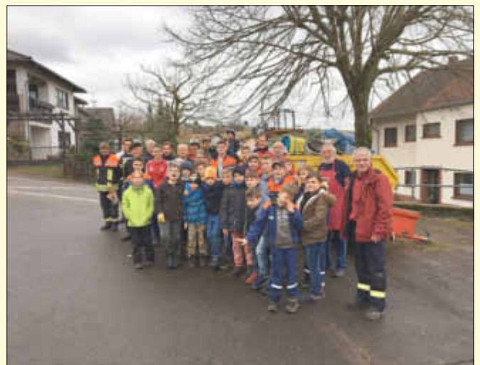
Die Saarfelser Teilnehmer