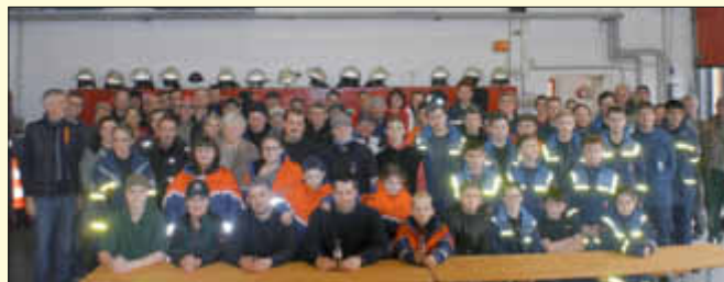
Die große Helferschar in Beckingen