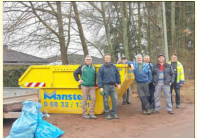
Teilnehmer an der Aktion in Oppen

In Oppen hatte sich eine relativ kleine Helferschar zwei größere Gebiete zur Säuberung vorgenommen. Zum einen war dies das Gelände um den Dorfplatz und den Oppener Weiher, wo man den durchfließenden Bach von allerlei Müll befreite. Auch der Containerstellplatz wurde komplett gesäubert. Den anderen Schwerpunkt der Säuberungsaktion bildete das Gebiet um den Parkplatz beim Sportplatzgelände bzw. Kindergarten sowie das Sportgelände selbst.