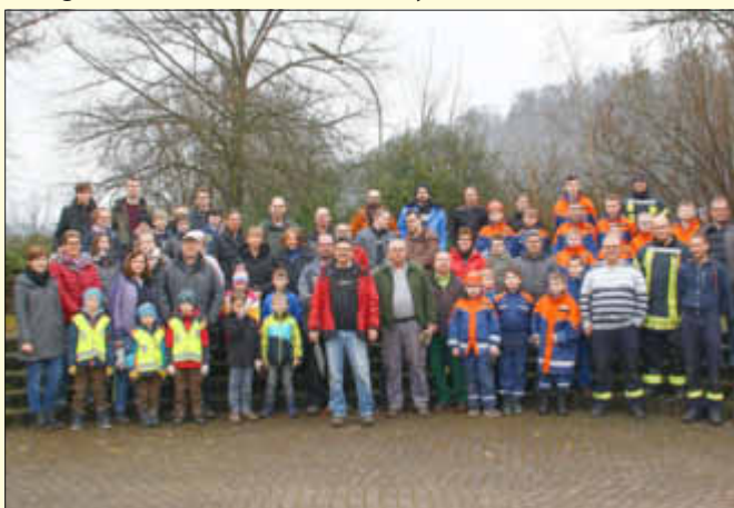
Auch Haustadt konnte eine große Helferschar aufweisen

Im Gemeindebezirk Haustadt, der sich turnusgemäß alle zwei Jahre an der Picobello-Aktion beteiligt, fanden sich in diesem Jahr mehr als 60 Personen, davon ca. 20 Kinder und 10 Jugendliche als Mitglieder der örtlichen Vereine und Privatpersonen, zu Beginn der Aktion auf den Dorfplatz ein. Besonders stark vertreten waren der Jugendclub (auch viele „Ehemalige“), Feuerwehr und Jugendfeuerwehr, Musikverein, Karate-Dojo-Club, Obst- und Gartenbauverein, MIG 78, Hundesportfreunde, Vorschulausschuss Kindergarten und auch Mitglieder des Ortsrates. Entlang einer Strecke von ca. 10,0 km Wald- und Feldwegen auf dem Haustadter Bann, beispielsweise Am Weiher in Hellischten, entlang des Feldweges im Anschluss an die Straße „Neue Welt“, dem Haustadter Berg, dem Weg im Anschluss an die Straße „Im Bungert“, rund um Bemerich und im Umfeld der Wertstoffcontainer wurde ein Container voll mit Unrat in Form von Autoreifen, Flaschen aus Glas und Plastik, Folien, Getränkeverpackungen, aufgerollten Drahtgeflechten, Abdeckplanen, Teppichen, Regenwassertonnen und sogar ein Handwaschbecken eingesammelt. Im Anschluss an die Sammelaktion stärkten sich die Teilnehmer dann im Feuerwehrgerätehaus bei Getränken und Lyoner mit Brötchen.