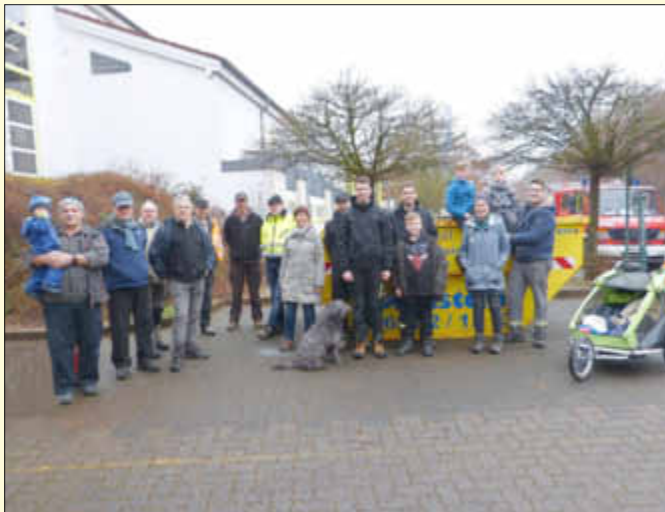
Die Hargarter Teilnehmer