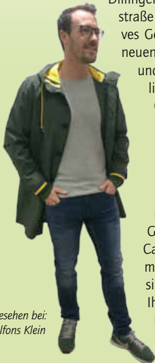
gesehen bei: Alfons Klein

Dillingen bietet alles! Neben Mode, Beauty, Lifestyle und Kultur haben Sie auch stets die Möglichkeit, das umfangreiche Angebot der Dillinger Gastronomie, wie z.B. Linn's Café & Bistro, zu nutzen. Die meisten Geschäfte in Dillingen sind inhabergeführt, wodurch Ihnen Service und Freundlichkeit garantiert ist!