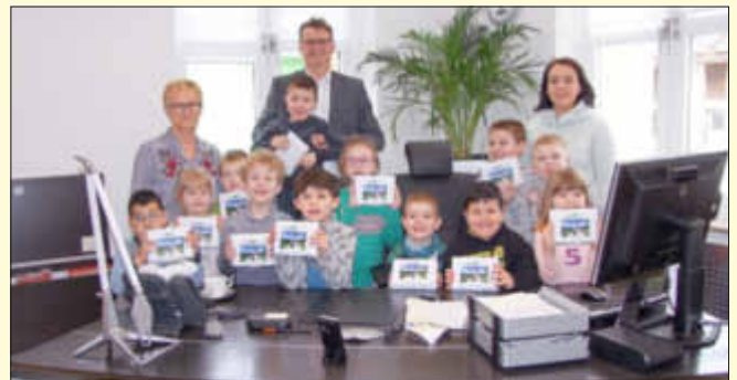
Die Vorschulkinder der KiTa St. Mauritius Haustadt bei ihrem Besuch im Arbeitszimmer des Bürgermeisters.