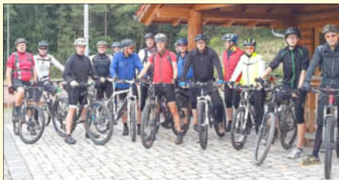
Start ist an der Oppener Hütte in Oppen.

Bei Bedarf wird in mehreren Gruppen gestartet, die aber angeführt werden durch bekannte Guides wie „Dämon“ Christian Strunk, Michael Buchheit und Hans Cuntz. Eine Anmeldung ist erwünscht. Weitere Infos: Hans Cuntz vom RSC Haustadter Tal, 06832/1555 oder bei der Gemeinde Beckingen, Tel.: 06835/55-105 oder -151 sowie freitags nach 13 Uhr unter 01603389033. Die Schlusseinkehr für alle Teilnehmer findet in der Oppener Hütte statt.