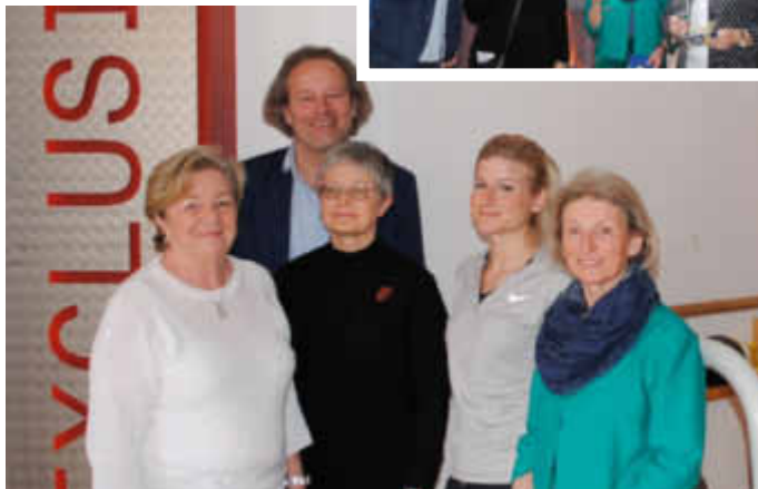
Im med. Fitnessstudio Exclusive