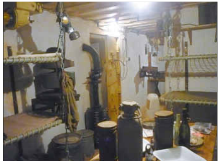
Das Bunkerleben im Jahr 1938 wird am Sonntag 15. April im Museumsbunker Düppenweiler, Diefflerstr., gezeigt.