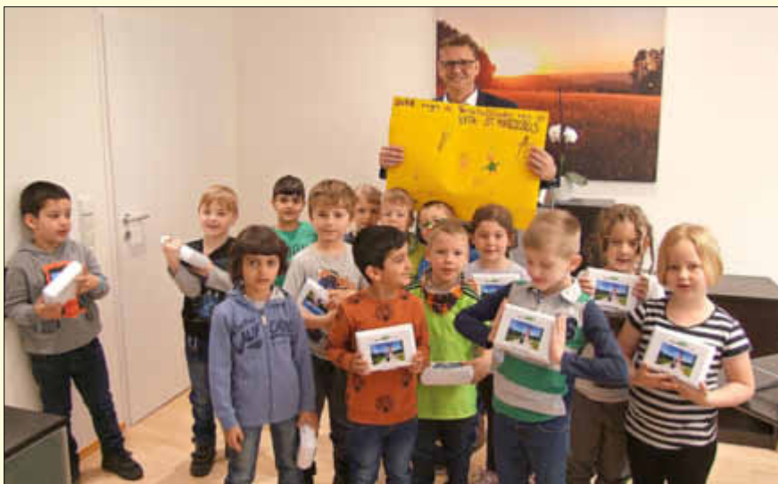
Die Vorschulkinder der KiTa ST. Marzellus Beckingen hatten dem Verwaltungschef ein kleines „Dankeschön“ mitgebracht.

Nach der aufregenden Tour durch das Rathaus fand der spannende Vormittag beim gemütlichen Picknick im Sitzungssaal sein Ende, wobei sich hier noch die Gelegenheit bot, ein schönes Bild zu malen.