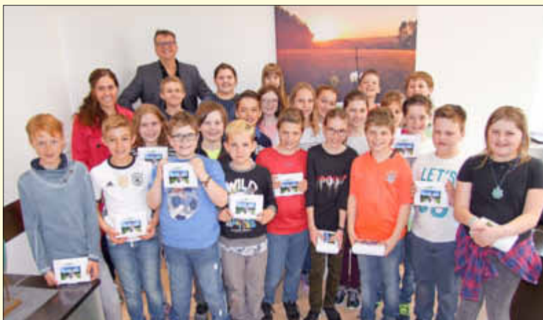
Die Klasse 4.1 im Büro des Bürgermeisters

Weil wir im Sachunterricht das Thema Saarland und unsere Gemeinde besprechen, hat unsere Klasse am Donnerstag, dem 12.04.2018, das Beckinger Rathaus besucht.