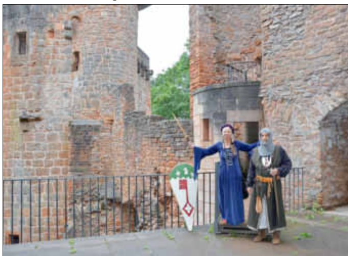
Ritter „Guy de Montclair“ und seine Burgdame erzählen spannende Geschichten über die Burg Montclair

Informationen und Burgbistro, telefonisch (0 68 61) 80-235 zu den Öffnungszeiten der Burg; Gastronomie: E-Mail an gastronomie@burg-montclair.de , Besucherservice: E-Mail an info@burg-montclair.de Im Internet: www.burg-montclair.de