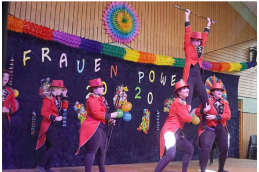
Die Tanzgruppe „Showgirls“ aus Rissenthal bei ihrem Auftritt