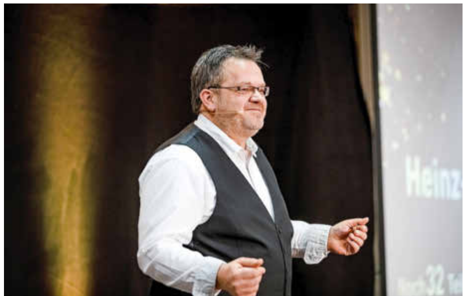
Die Bilder sind Rechtfrei.

öfters mal den Blickwinkel auf die „Dinge“ zu verändern. Das komplette Bühnenprogramm ist in kürze buchbar. Gleichzeitig wurde an diesem Tag der Weltrekord gebrochen. Nie waren mehr Redner gleichzeitig auf einer Bühne als in München. Initiator dieser Veranstaltung ist Hermann Scherer, der nicht nur in der