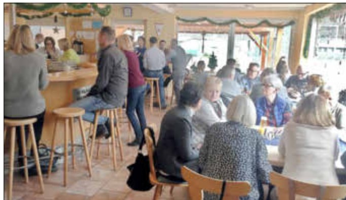
Tolles Buffet, tolle Menschen, tolles Wetter - volles Haus beim Neujahrsbrunch

Als alle gestärkt (oder doch eher pappsatt) waren, wartete noch ein kleiner Programmpunkt auf die Gesellschaft: die Ehrung der Meistermannschaften der Aktiven und Senioren. Die Damen 30, Meister der Landesliga, die Damen 50_1, Meister der 2. Regionalliga und die Herren 60_1, Meister der Verbandsliga bekamen jeweils eine Urkunde, einen Verzehrutschein im Clubhaus und natürlich den verdienten Applaus. Bis auf die Damen 50_1 werden alle Meister den Aufstieg wahrnehmen. Unsere Vorsitzende nutzte die Gelegenheit um die Anwesenden auf wichtige Änderungen in den Spielregularien und den Mannschaftsmeldungen des Vereins hinzuweisen. Danach wünschte sie allen einen weiter schönen und entspannten Mittag bei unserem Brunch, worauf einige bis zum Abend noch in unserem Clubheim beisammensaßen. Eine rundum gelungene Veranstaltung!