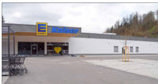
1) In einer Bauzeit von rund elf Monaten ist der neue Edeka-Markt in Beckingen entstanden

Nähere Informationen zum neuen Markt unter Facebook oder Instagram unter EDEKA Kaiser.