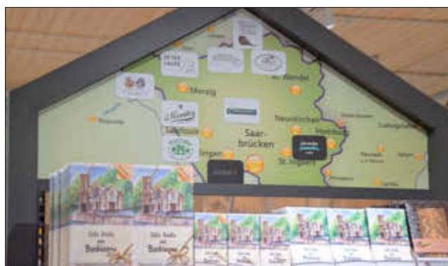
3) Eine der Hinweistafeln auf die Herkunftsorte regionaler Produkte