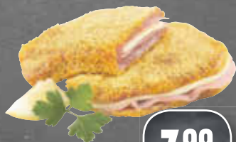
Cordon bleu vom Schwein, 1 kg