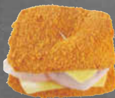
Fleischkäse-Cordon-bleu 1 kg