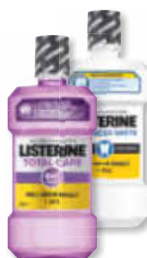
Listerine Mundspülung versch. Sorten 600 ml 1 l = 6,47