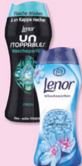
Lenor Wäscheduft versch. Sorten 15 WL 1 WL = 0,29