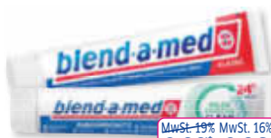
Blend-a-med Zahncreme versch. Sorten 75 ml 100 ml = 0,89

DEIN DROGERIEMARKT TALSTR. 266 IN BECKINGEN