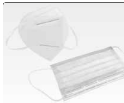
FFP1 / FFP2