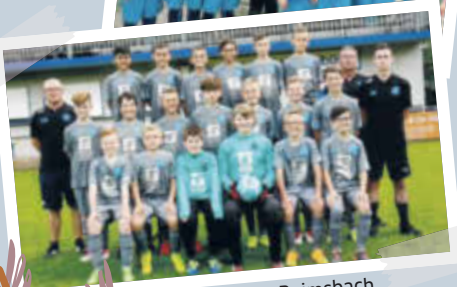
D Jugend FC Reimsbach

Gemeinsam wollen wir Gutes tun und unser Patenprojekt „Fußballjugend Reimsbach“ unterstützen.