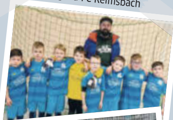
F Jugend FC Reimsbach