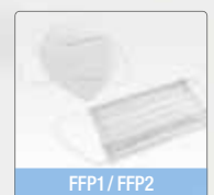
FFP1 / FFP2