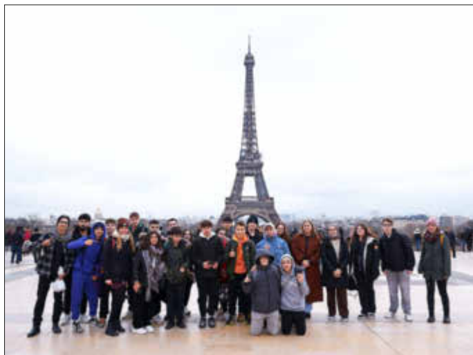
Die Schülerinnen und Schüler der FBKS in Paris

Mit der Metro fuhren wir danach zum Louvre - bekannt natürlich durch das berühmteste Gemälde der Welt: Die Mona Lisa von Leonardo da Vinci.