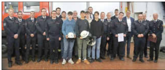
2) Die Beförderten und die in die aktive Wehr übernommenen sowie weitere Wehrleute stellten sich mit der alten und neuen Führung sowie Gästen zum Gruppenfoto.