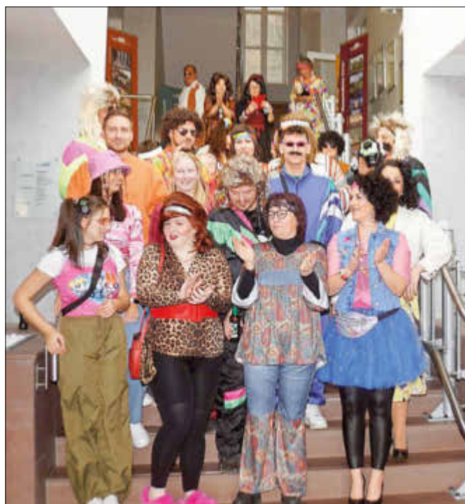
Das tapfere Personal versuchte das Rathaus zu verteidigen