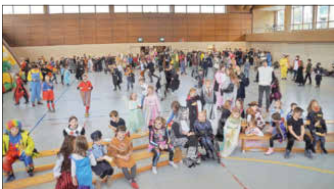
Blick in die Deutschherrenhalle