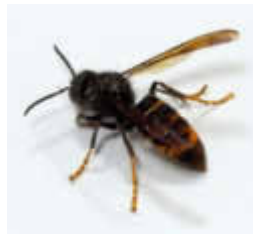
Foto: Die Asiatische Hornisse Vespa velutina

Die Tiere sind ungefähr so groß wie unsere einheimischen Hornissen, sind aber zum größten Teil schwarz gefärbt. Nur der überwiegend schwarze Hinterleib trägt dünne, gelb-orangene Binden und die Füße sind gelb. Im Flug erscheint die Asiatische Hornisse eher schwarz, im Gegensatz zu unserer einheimischen Hornisse, Vespa crabro, welche im Flug einen gelben Eindruck macht.