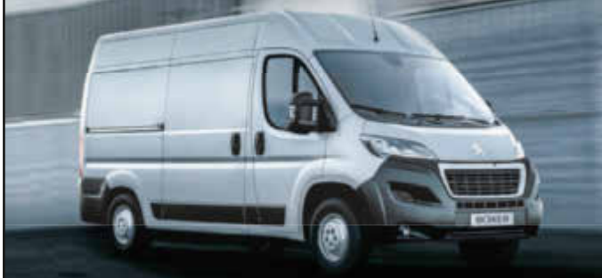
Abb. zeigt nicht angebotenes Beispielfahrzeug