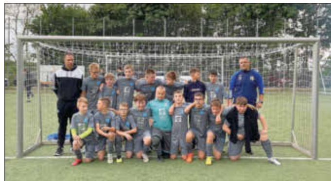
Meistermannschaft mit ihren Trainern