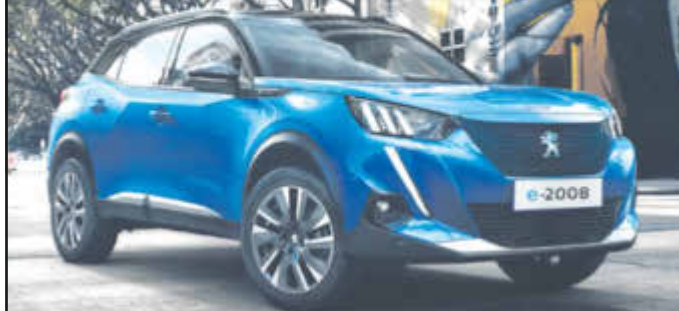
Abb. zeigt ggf. aufpreispflichtige Sonderausstattung.

Auch in anderen Ausstattungs- und Farbvarianten erhältlich