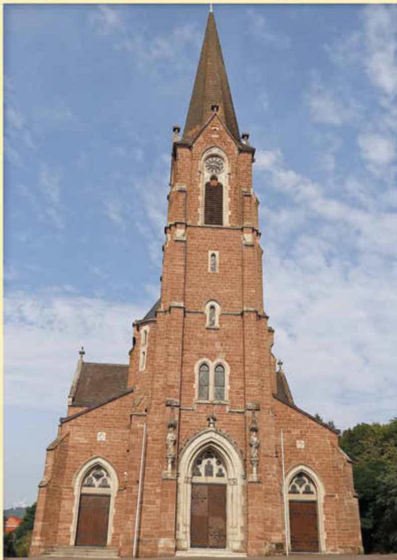
St. Andreas Kirche Reimsbach

Freitag, 26.05.2023 bis Dienstag, 30.05.2023