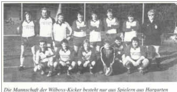
Die Mannschaft der Wilboys-Kicker besteht nur aus Spielern aus Hargarten