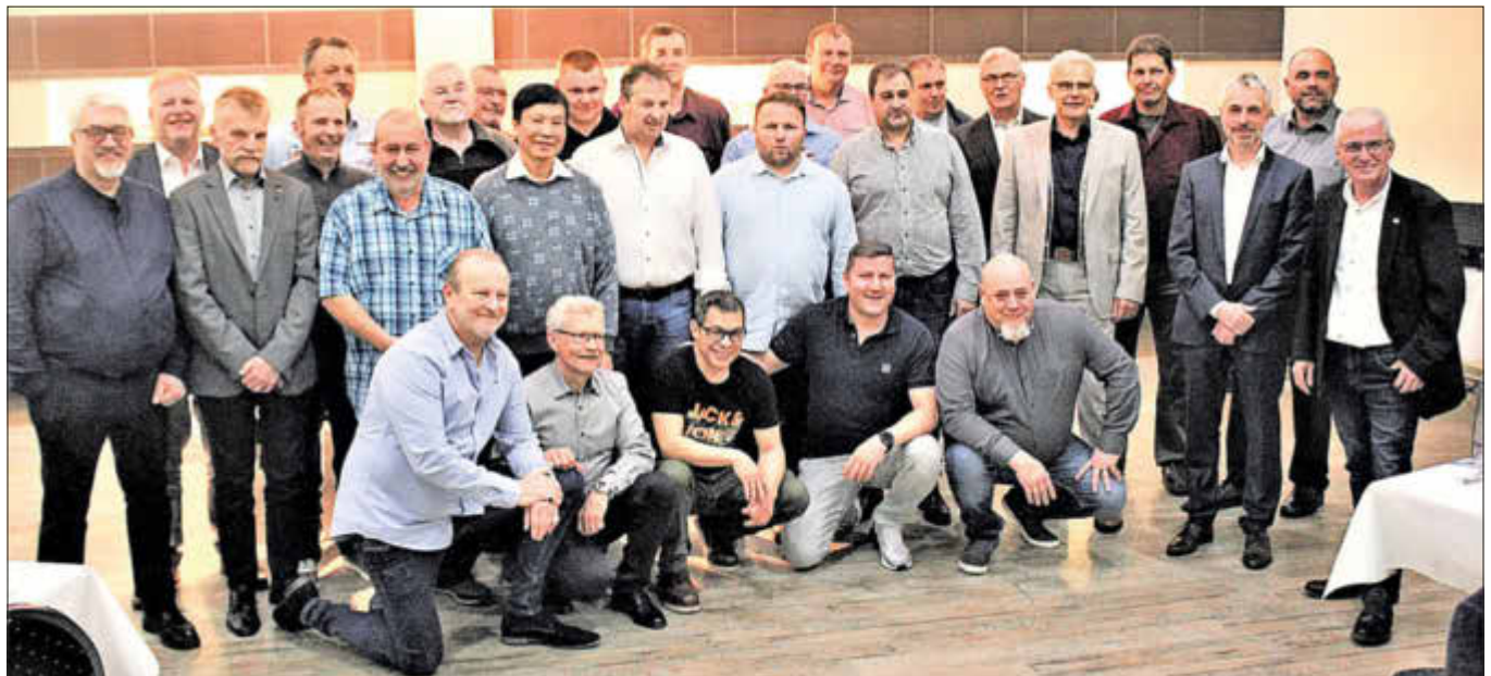
Die geehrten Jubilare mit der Geschäftsführung und dem Betriebsrat.