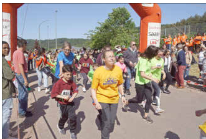
Mit viel sportlichem Ehrgeiz machten sich die Teilnehmer auf die Laufstrecke.