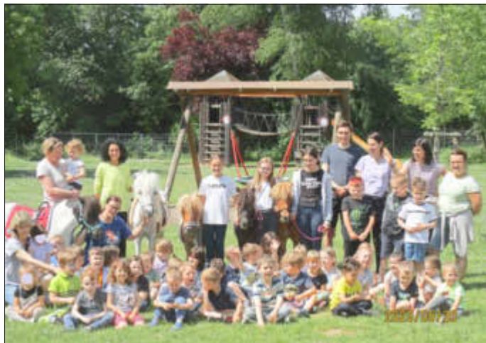
Einige Kinder, Kitaleitung und Pädagogische Fachkräfte mit den Ponys und deren Begleitpersonen

Am Dienstag, 30. Mai 2023 besuchten Ponys des Reiterhofes „Ilsenhof“ mit ihren Begleitpersonen die Kinder unserer Kindertageseinrichtung. Gruppenweise bestand für alle Kinder die Möglichkeit Kontakt zu den Tieren aufzunehmen. Gerne streichelten die Kinder die Ponys und selbst Krippenkinder unter drei Jahren trauten sich aufs Pony zu sitzen und geführt von den Begleitpersonen im Schritt zu reiten. Besondere Freude hatten Kinder und Ponys nach dem Ritt: die Tiere duften von den Kindern gebürstet werden. Dieser Besuch sollte ein Angebot für alle unsere Kita- Kinder sein, Ponys aus der Nähe zu erleben und jedes Kind entschied selbstverständlich vor Ort, ob es dies tatsächlich auch tun wollte.