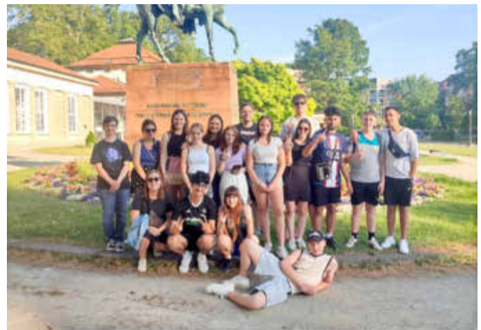
Die Klasse 10 in Stuttgart

Für unsere 10er ging's auch per Zug – aber nach Stuttgart. Neben badischer Kultur (Großstadt, Museum, Parks ...) und Kulinarik (gemeinsames Abendessen, Mangoeis) kamen auch typische Klassenfahrtserfahrungen und Spieleabende (Stadt-Land-Präposition) nicht zu kurz.