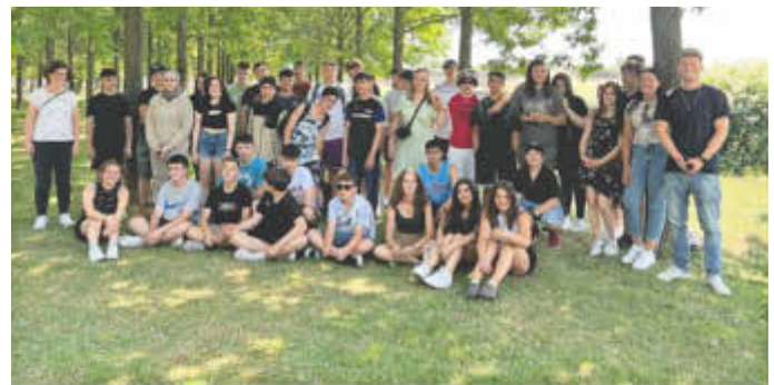
Die Klassen 9a & 9b in Koblenz

Highlights waren der Besuch des Kletterparks und die Abkühlung im Freibad – und zum Shoppen war auch noch Zeit.