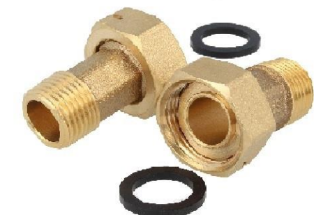
Wasserzählerverschraubung 3/4" mit 1" Überwurfmutter

oder am besten gleich einen Zählerbügel verwenden