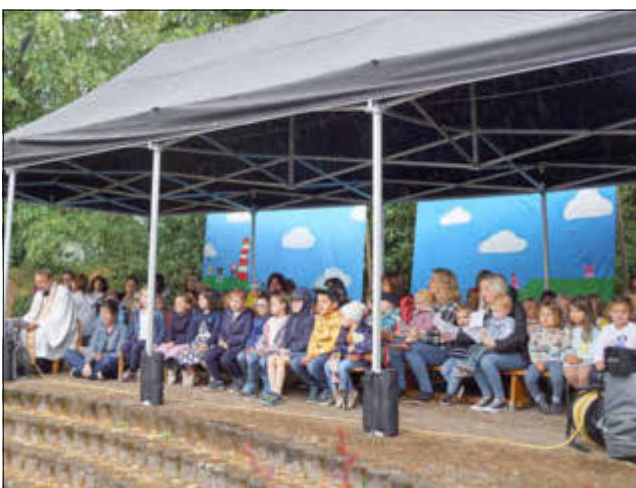
3) Wortgottesdienst mit den Kindern zu Beginn des Jubiläums- und Einweihungsfestes