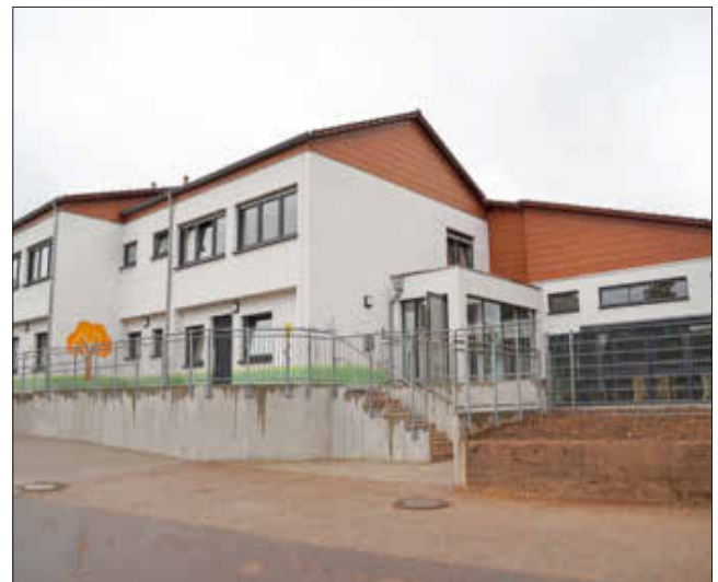
6) Das KiTa-Gebäude ist nach der umfassenden Sanierung fast nicht mehr wiederzuerkennen.