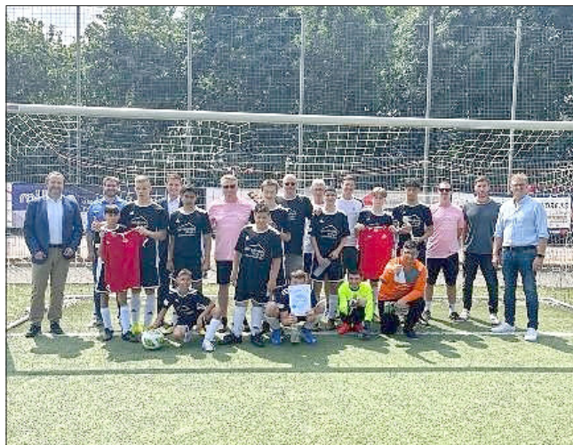
Die Siegermannschaft der Biedersbergschule Neunkirchen mit Gastgebern und Gästen