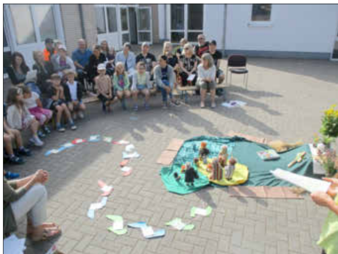
Dankgottesdienst auf dem Außengelände der Kita

Anschließend freuten sich die Kinder auf die von ihnen gewünschte Busfahrt nach Bettembourg/Luxemburgden in den Tier- und Freizeitpark „Parc de Merveilleux“. Dort verbrachten sie einen unvergesslichen gemeinsamen Tag mit Eltern und Erzieherinnen.