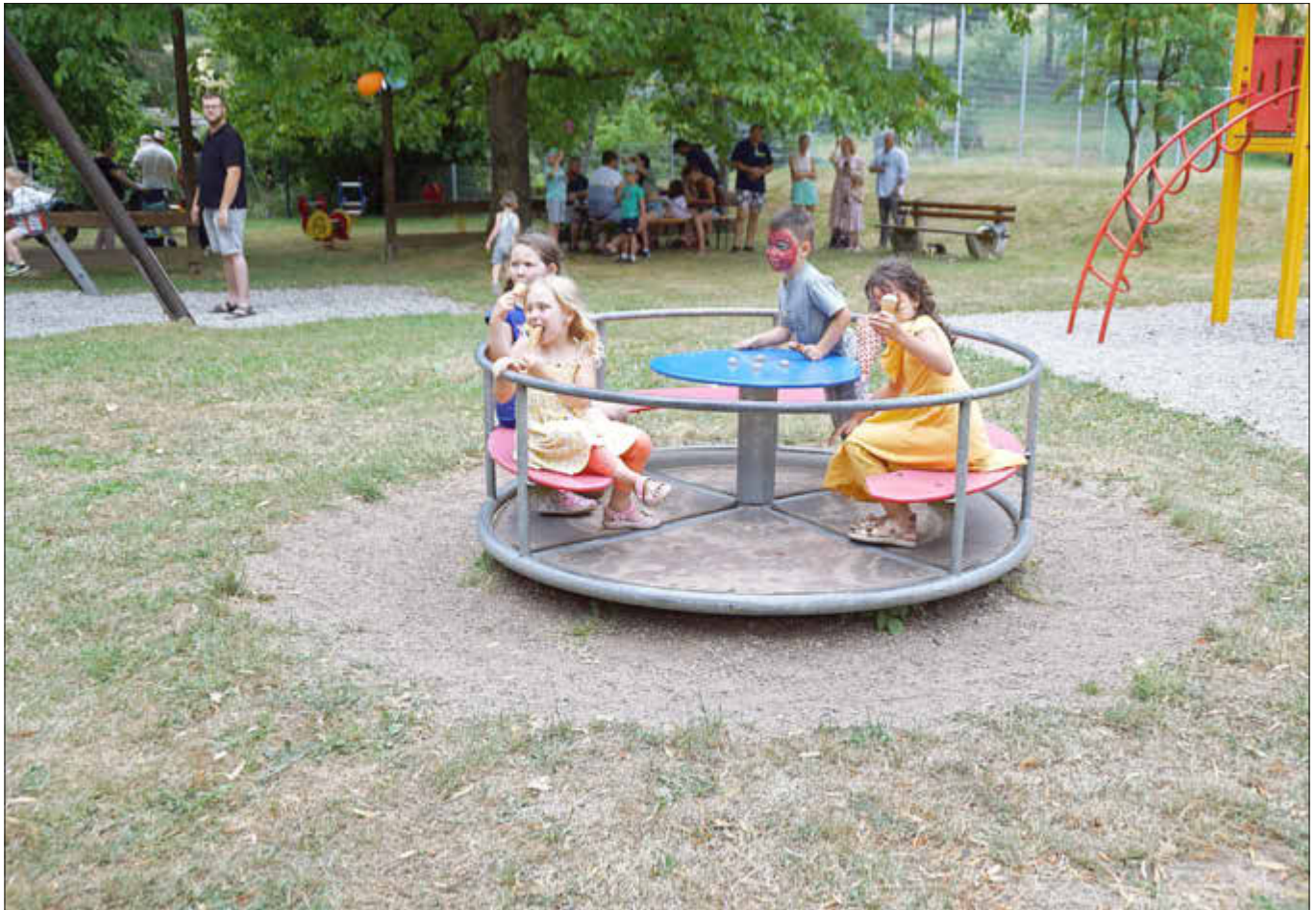
Mit spendiertem Eis hatten die Kinder auf dem Karussell ihren Spaß

An alle Vereine, Verbände und Institutionen in der Gemeinde Beckingen