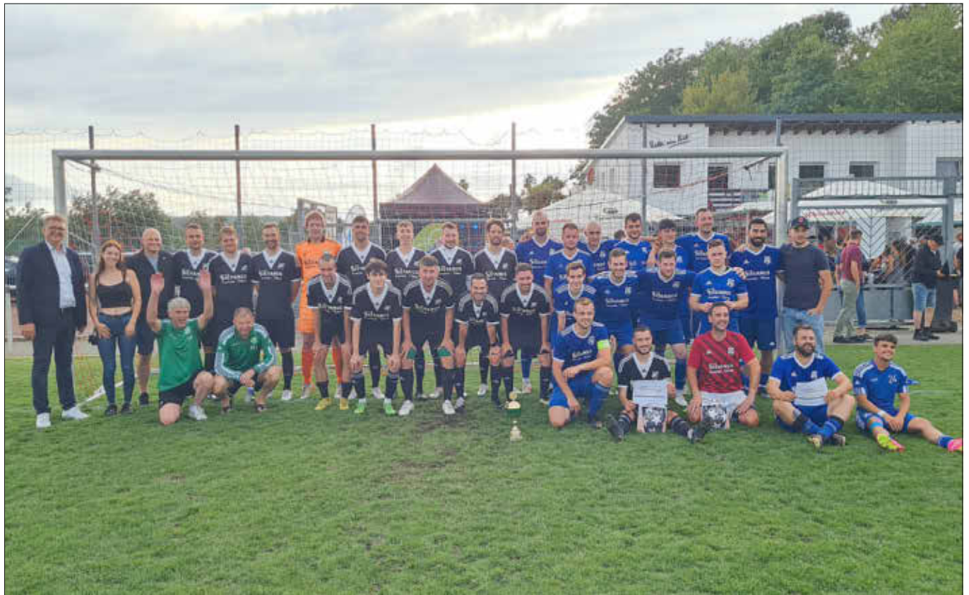
Gruppenfoto 1. Sieger FC Reimsbach (hellblau) / 2. Sieger SSV Oppen (dunkelblau)