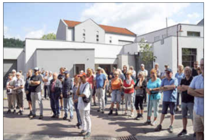
Blick auf die Teilnehmer bei der Eröffnung