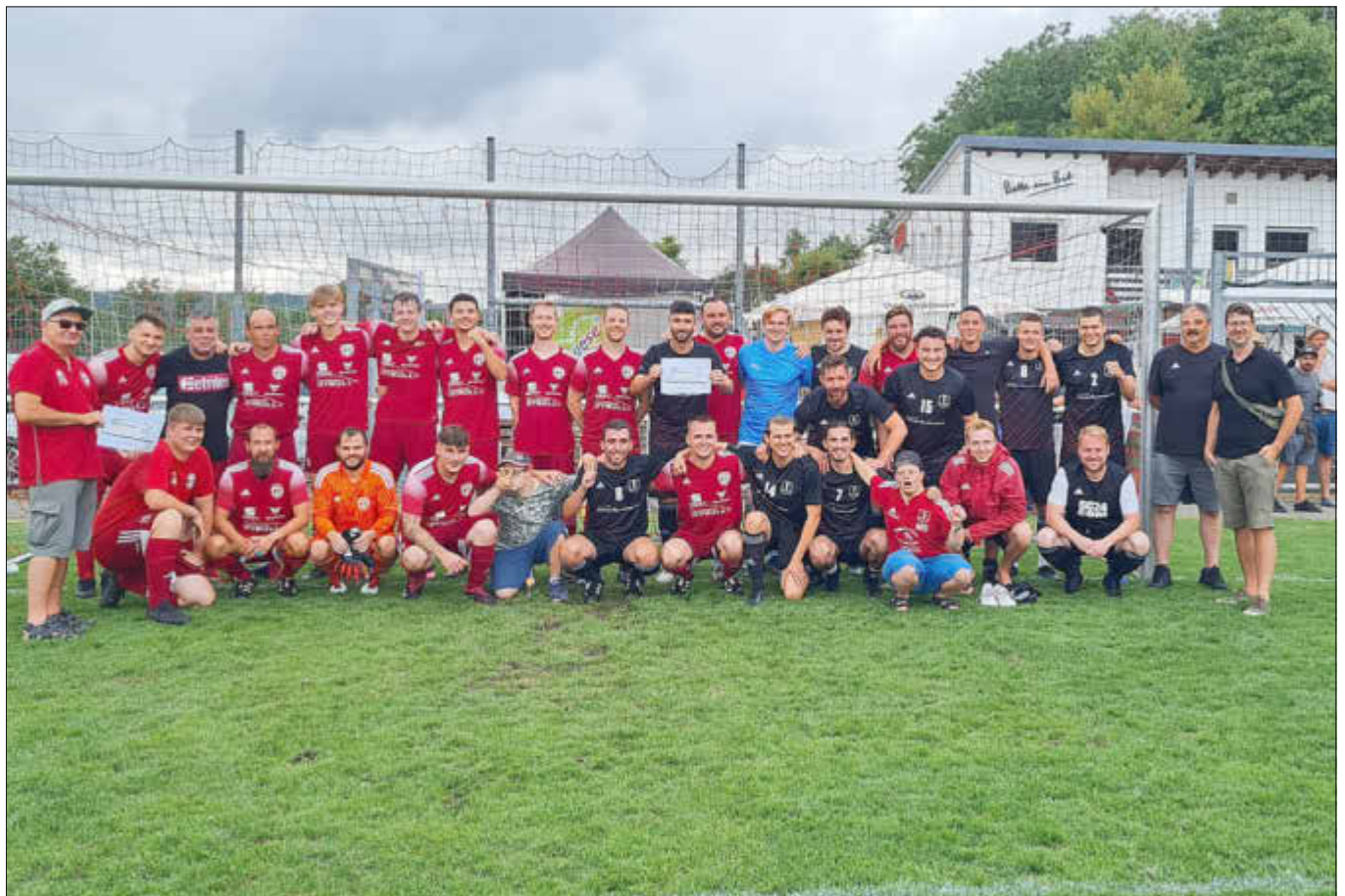
3. Sieger SG Honzrath-Haustadt (schwarz) und 4. Sieger SF Saarfels (rot)