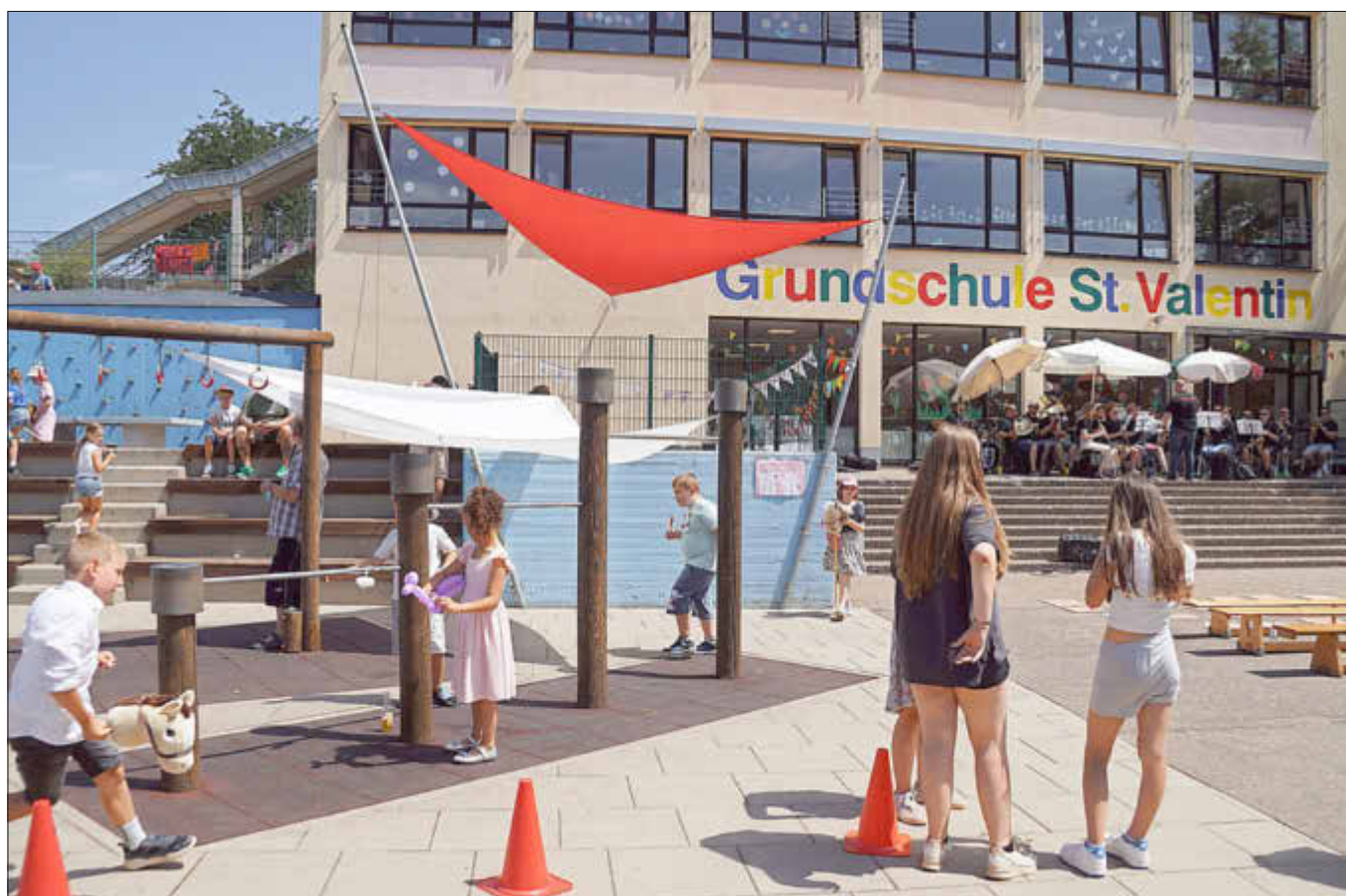
Zur guten Laune trugen Spiele und die Musikfreunde Haustadt-Honzrath bei.