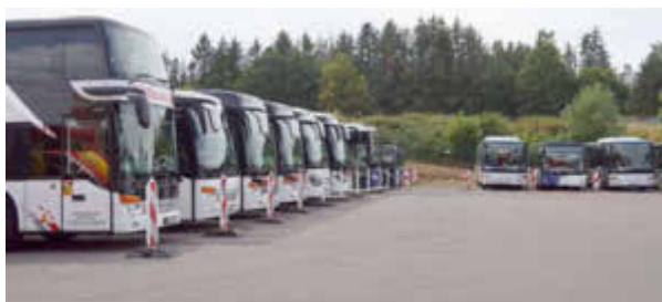
Blick auf einen Teil der Busse