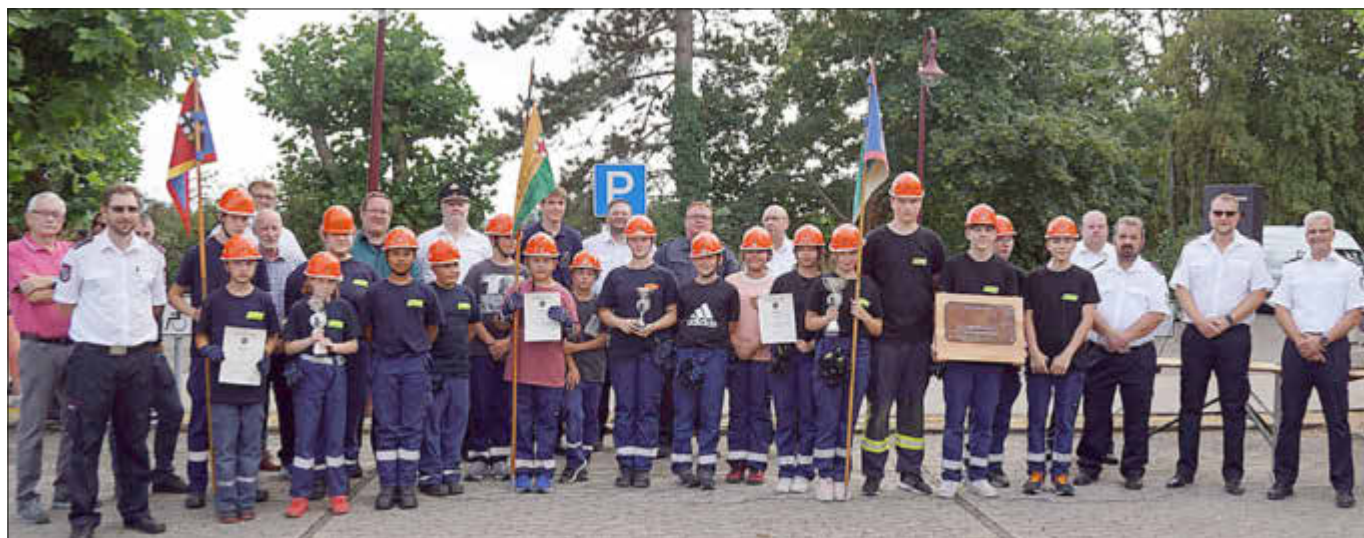
Die Gewinner der Begleitspiele ebenfalls mit Führungskräften und Gästen.