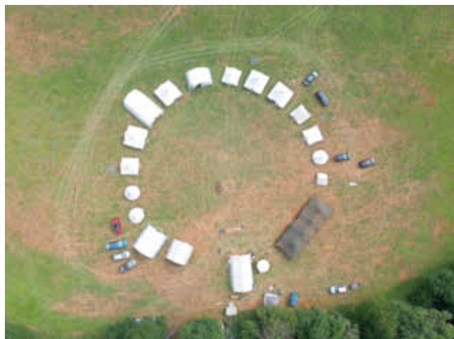
Das Zeltlager von oben.

Einfach mal im Zelt leben und mit wenigen Dingen auskommen, das war für rund 50 Kinder eine interessante Erfahrung beim 41. Zeltlager der Jugend Saarfels, das vom 24. bis 30. Juli 2023 auf einer Wiese an der „kleinen Dhron“ bei Gräfendhron im Hunsrück stattfand. Organisiert wird das Zeltlager immer in der ersten Ferienwoche der großen Sommerferien von der Jugend Saarfels e.V. Über 80 Teilnehmer, davon rund 50 Kinder und Jugendliche im Alter von 9 bis 17 sowie 30 Betreuer mit fleißigem Küchenteam und den „Lager-Mamas“ tummelten sich so eine Woche auf der großen Wiese am Bach und genossen ein abwechslungsreiches Programm, und das ohne Strom sowie weitestgehend ohne Handy, WLAN etc. Initiiert hatte das Zeltlager im Jahre 1981 Pater Hermann Esser, das damals in Sensweiler stattgefunden hatte. Die große Wiese in Gräfendhron war 1982 zum ersten Mal Ziel der Jugend Saarfels, inzwischen ist man hier zum sechsten Mal zu Gast und wird von einem