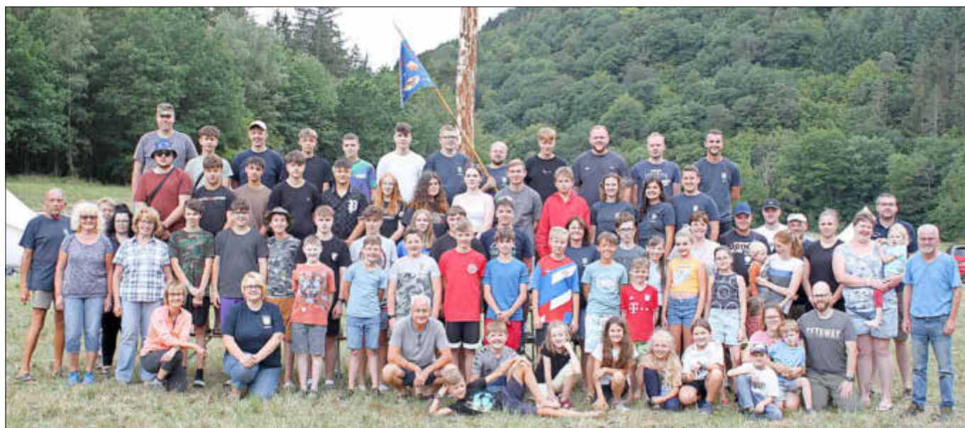
Gruppenfoto aller Teilnehmer mit Betreuern

Doch bevor der große Spaß losging, hatte der „Vortrupp“ das viele Material wie Materialzelt, Küchenzelt, Tischtenniszelt, zwei Aufenthaltszelte 13 Schlafzelte sowie WC- und Waschgelegenheit zum Standort transportiert und aufgebaut.