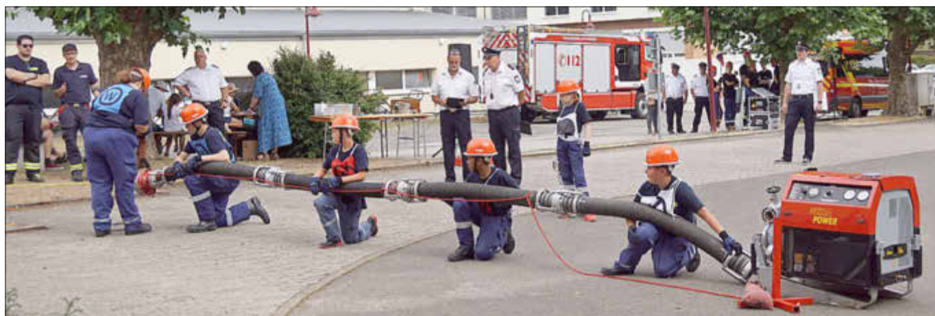
Auch der Aufbau einer Saugleitung musste unter anderem im Wettkampf erfolgen.