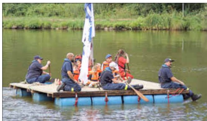
Die romantischen Floßfahrten des THW/DLRG auf dem angrenzenden Weiher fanden wie viele andere Angebote der Vereine und Organisationen großen Anklang

Donnerstags, freitags und samstags von 15 bis 19 Uhr sowie sonntags und an Feiertage von 13 bis 19 Uhr.