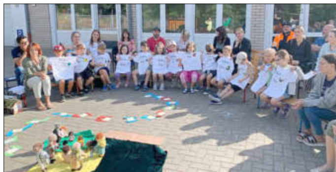
Vorschulkinder mit den gespendeten T-Shirts

Die Ziele unseres Fördervereins sind vor allem die ideelle und finanzielle Unterstützung der pädagogischen Arbeit und besondere Hilfen bei Projekten, Angeboten und Neuanschaffungen. Dem Verein beitreten können nicht nur Eltern, sondern auch Freunde, Verwandte und andere Personen, die unsere Kindertageseinrichtung unterstützen möchten. Anmeldebögen gibt es bei den Vorstandsmitgliedern und in der Kindertageseinrichtung. Das Kita-Team