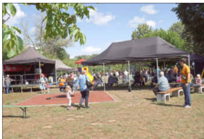
Blick auf den belebten Spielplatz