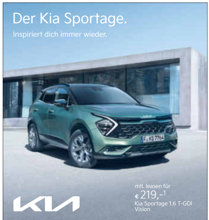
Abbildung zeigt kostenpflichtige Sonderausstattung.

Geschäftsanzeigen online aufgeben: anzeigen.wittich.de