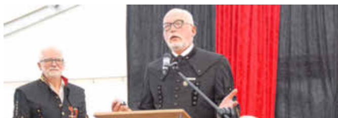
Der Bundesvorsitzende der Bergmanns-, Hütten- und Knappenvereine bei seinem Grußwort