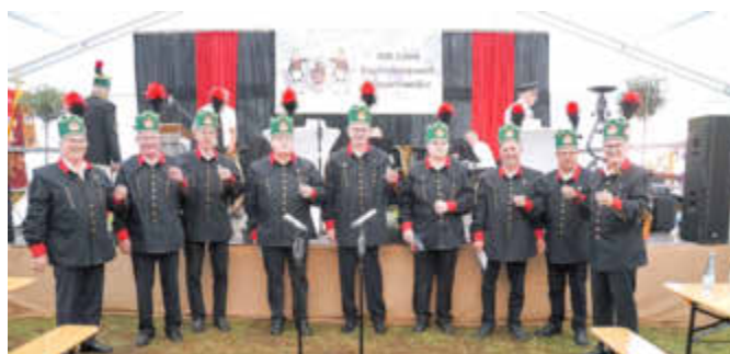
Die Bergsänger trugen viel zur Programmgestaltung bei