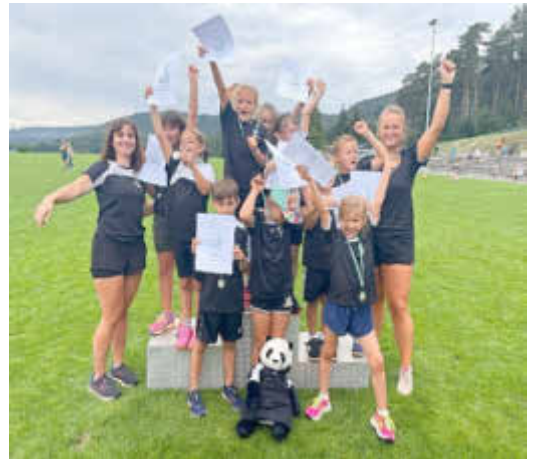
1. Platz LG`s rasende Hasen LG Reimsbach-Oppen

Das 16. Inklusive Leichtathletiksport der LG Reimsbach Oppen war wieder ein voller Erfolg. Die Lückner-Arena in Oppen war wieder der Ausaustragungsort des einzigen inklusiven Kinderleichtathletiksportfestes im Saarland. Bei idealem Wetter gingen 285 Kinder aus 8 Vereinen und 13 Kinder mit einer Beeinträchtigung (betreut durch den Kultur- und Sportverein für Menschen mit Beeinträchtigung) an den Start. Die kleinsten Leichtathleten*innen (3 – 7 Jahren) und die Kinder bzw. jungen Erwachsenen mit Beeinträchtigung absolvierten einen Dreikampf.