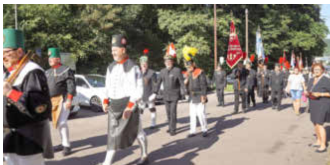
Aufmarsch der Bergparade am Sonntagmorgen