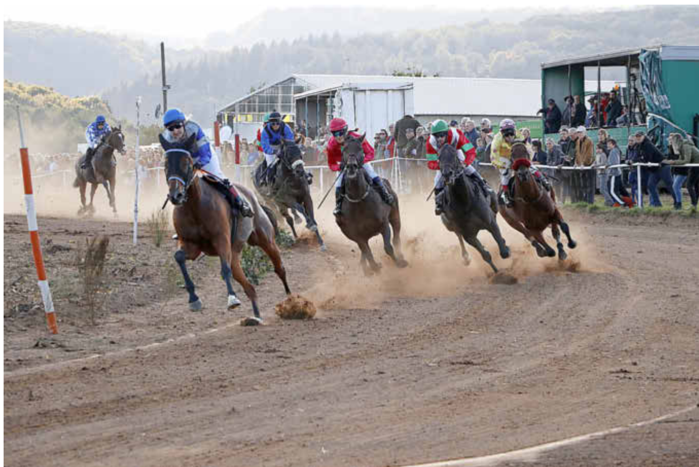
Beim Galopprenntag des RRV Honzrath am Montag, 2. Oktober 2023, wird die Honzrather Heiderrennbahn ab 15 Uhr wieder zum Mekka aller Freunde des Galopprennsports.