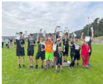
Siegerehrung der Menschen mit Beeinträchtigung

Die 8- bis 11- jährigen mussten einen Vierkampf bewältigen. Neben dem klassischen Sprint und Wurf mussten die Teilnehmer/innen auch Disziplinen bewältigen, die extra für den Kinderleichtathletikwettbewerb entwickelt wurden. So zum Beispiel der Fünfsprung, der Hochweitsprung, der Zonenweitsprung oder aber auch die Hindernisstafel.