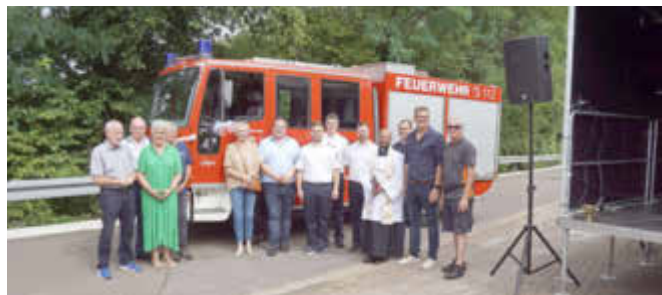
Das neue Hargarter Löschfahrzeug mit Bürgermeister Thomas Collmann und MdL Sebastian Schmitt sowie den weiteren offiziellen Gästen und Wehrführern

Infos zum Fahrzeug: Das LF 8/6, jetzt LF 10/6 bezeichnete Löschfahrzeug wurde im Jahre 1997 in Dienst gestellt. Es bietet Sitzplätze für eine Gruppe 1/8, besitzt eine eingebaute Pumpe nebst einem 600 Liter – Löschwassertank und hat viel Raum zum Einschleppen einer Tragkraftspritze sowie Mitführen diverser Einsatzgeräte.