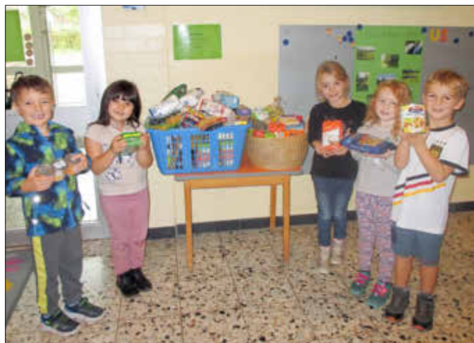
Kindergartenkinder mit gespendeten Lebensmitteln

Wir bedanken uns sehr herzlich bei allen teilnehmenden Familien im Namen der Menschen, die wir damit unterstützen können.