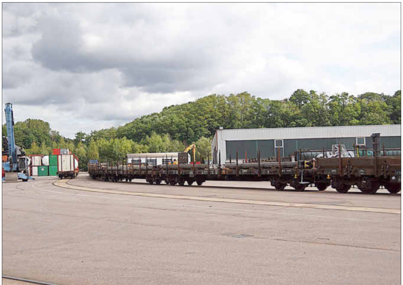
Blick auf das Betriebsgelände mit Eisenbahnwaggons zum Stahltransport

Interessenten können Firma Puhl GmbH, Südstraße 6, 66701 Beckingen (Telefon 06835/92220-0, E-Mail info@puhl.eu oder www.puhl.eu Näheres erfahren. nb