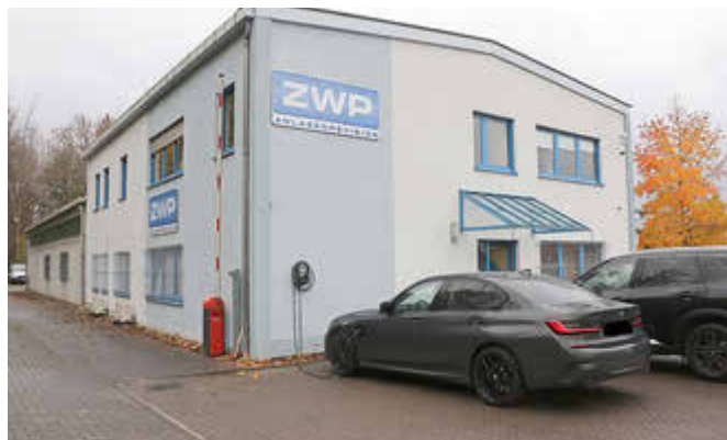
Blick auf den Gebäudekomplex der ZWP Anlagenrevision GmbH im Gewerbegebiet Beckingen Süd.