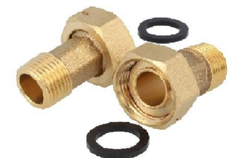
Wasserzählerverschraubung 3/4" mit 1" Überwurfmutter

oder am besten gleich einen Zählerbügel verwenden