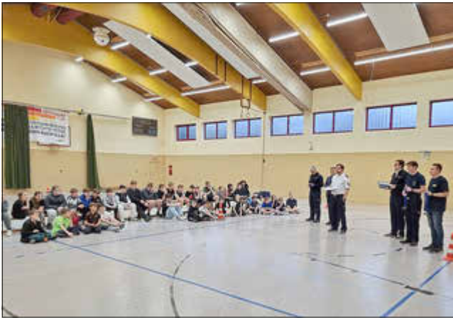
Gruppenfoto der Teilnehmer mit Betreuern und Gästen