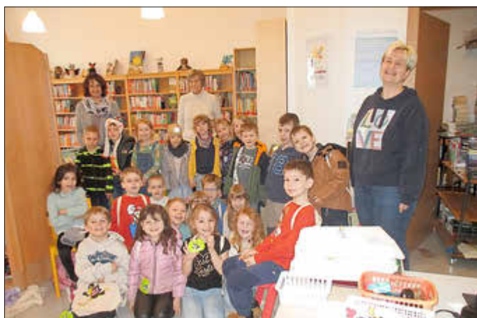
Gruppenfoto in der KÖB Beckingen

Vielleicht besuchen auch zukünftig die Eltern mit ihren Kindern die KÖB Beckingen, um deren Angebot zuhause zu nutzen.