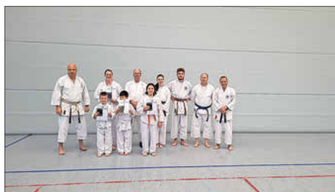
Unsere Jüngsten mit mit Trainer und Prüfer

Am 12. März haben unsere bisher jüngsten Karateka's, 6 Jahre alt, erfolgreich ihre Prüfung zum Gelben Gürtel bestanden. Auch 2 etwas „ältere“ Karateka's haben ihre Prüfung zum Gelbgürtel und Grüngürtel mit Bravour bestanden. Der Vorstand des Karate Dojo Haustadt e.V. und die Trainer/Prüfer gratulieren dazu recht herzlich.