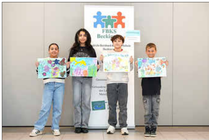
Schülerinnen und Schüler der Klassen 5a & 5b mit ihren Werken

Wir sind gespannt auf das Thema des Jugend Creativ Wettbewerbs im nächsten Schuljahr und werden wieder dabei sein!