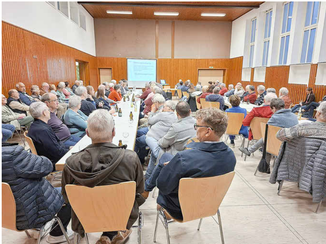
Blick in die Halle