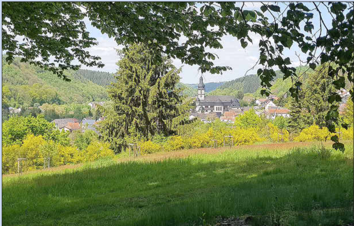
Blick auf Haustadt