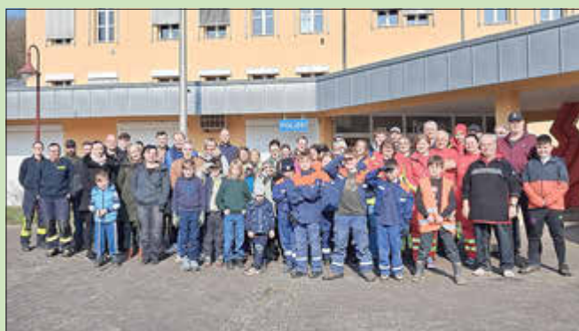
Nicht mit auf dem Foto: die Teilnehmer des Angelsportvereins sowie des Kultur- und Heimatvereins.

Auch in diesem Jahr machten sich am Samstag, dem 21. März, um 10:00 Uhr viele fleißige Personen, darunter viele Kinder, ausgestattet mit Handschuhen und Müllsäcken auf den Weg, um allerhand achtlos in der Natur entsorgten Müll einzusammeln. Neben den Ortsratsmitgliedern beteiligten sich wieder die Feuerwehr und Jugendfeuerwehr, DLRG, Kultur- und Heimatverein, der Angelsportverein, SPD und CDU, Eltern mit ihren Kindern sowie Privatpersonen. Gesammelt wurde an der Saar-Aue entlang des Leinpades der Saar, in der Dillinger Straße vom TÜV bis zum Bahnhof, in der Bergstraße, im Park entlang des Mühlenbaches, in der Waldstraße ab Tennisplatz bis Ausgang Beckingen, sowie in der Talstraße ab Edeka bis Ortseingang Haustadt usw. Zum Abschluss der Sammelaktion um 12:00 Uhr wurden alle Teilnehmer zu einem Umtrunk und Imbiss in die Deutscherhalle eingeladen, wo man sich nach getaner Arbeit, auf gut saarländisch, mit Lyoner, warmem Fleischkäse, Rohessern und Käsebrötchen für die Vegetarier und Getränken stärken konnten.